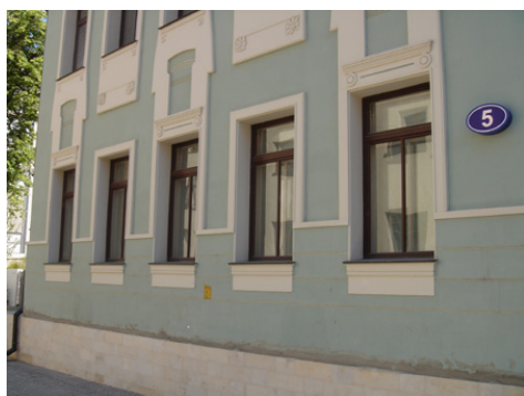
Вид с улицы на пулестойкие стекла