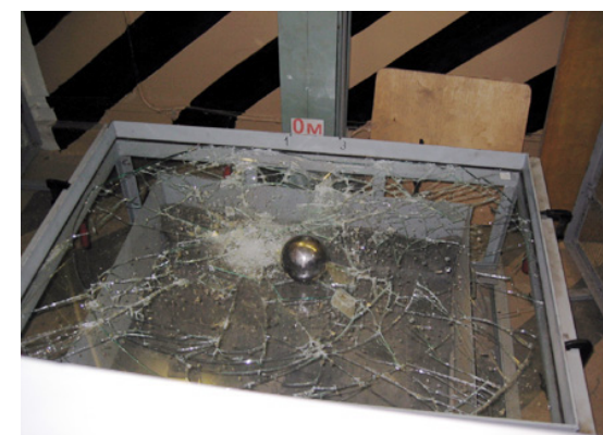
Испытание защитных свойств: Падение шара 4кг с высоты 15м