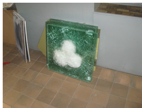
Бронестекло после испытаний