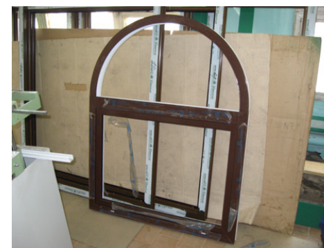
Арка пулестойкого окна