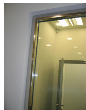
Отделка нержавеющей сталью